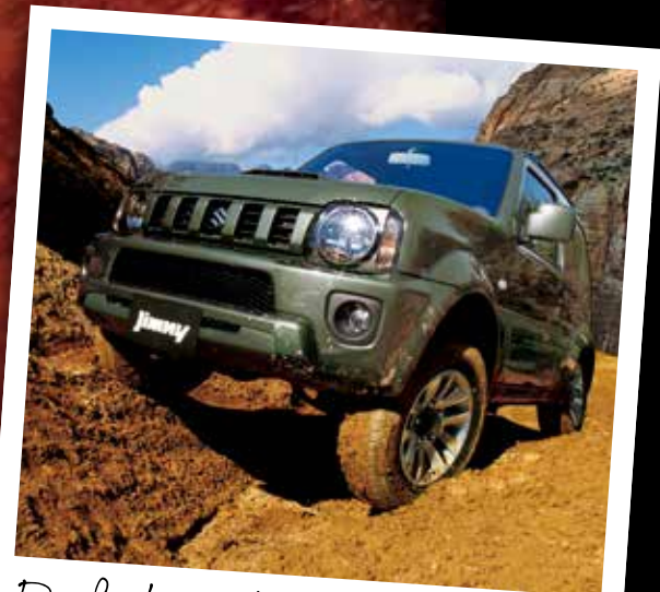
Parfait sur terrains accidentés